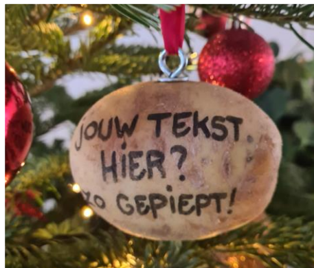
KERSTBALPIEPER VOOR IN DE BOOM