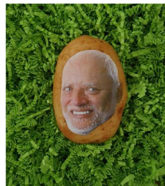
FOTOPIEPER WANT GEWOON LEUK