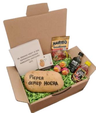
VERJAARDAGSPAKKET PIEPER DEPIEP HOERA