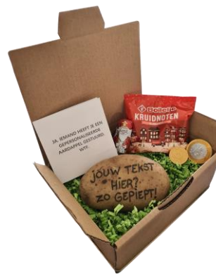
SINTERKLAASPAKKET MET KRUIDNOTEN