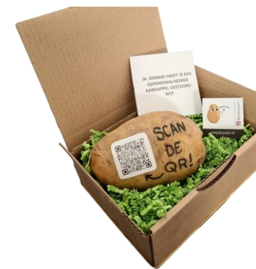
VIDEOBOODSCHAP VIA QR-CODE