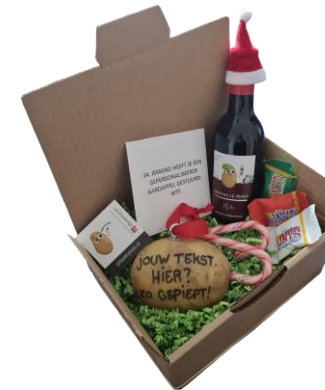
KERSTPAKKET MET LEKKER WIJNTJE